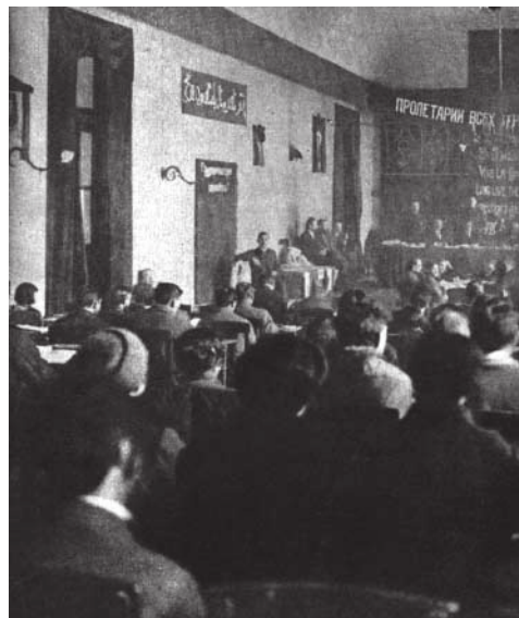
Φωτογραφία από το πρώτο συνέδριο της Κομμουνιστικής (Τρίτης) Διεθνούς

γότερο υπαγορευμένη από τη συνείδηση του πραγματικά συλλογικού συμφέροντος των εργατών και του τελικού αποτελέσματος του επαναστατικού αγώνα, από ότι η πολιτική γραμμή του οργανωμένου κόμματος. Η αντίληψη που υποστηρίζει το δικαίωμα του προλεταριάτου να ελέγχει την ταξική του δράση είναι μόνο μια αφαίρεση αποστερημένη από κάθε Μαρξιστική λογική. Κρύβει την επιθυμία να μεγεθυνθεί το κόμμα περιλαμβάνοντας λιγότερο ώριμα στρώματα. Όσο μεγεθύνεται, οι αποφάσεις του τείνουν όλο και περισσότερο να ενσωματώνουν αστικές και συντηρητικές ιδέες. Αν ψάχναμε για αποδείξεις, πέρα από τη θεωρητική έρευνα, στις ιστορικές εμπειρίες, η συγκομιδή μας θα ήταν πλούσια. Ας θυμηθούμε ότι αποτελεί πλέον τυπικό αστικό κλισέ να αντιτάσσεται η καλή «κοινή λογική» των μαζών στο «κακό» μιας μικρής «μειοψηφίας από αγκιτάτορες» και να παριστάνουν οι