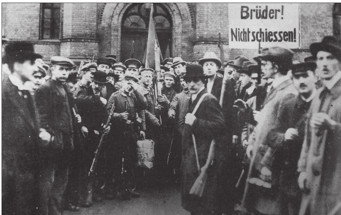
Βερολίνο, 1918. Οι αντιπρόσωποι ενός συμβουλίου εργατών και στρατιωτών μπροστά σε ένα στρατόπεδο. Στο πάνω αναγράφεται: "Αδέρφια, μην πυροβολείτε!".

Αυτοί που μιλάνε για «επαναστατικό κόμμα» αντλούν ανολοκλήρωτα και περιορισμένα συμπεράσματα από την ιστορία. Όταν τα σοσιαλιστικά και κομμουνιστικά κόμματα έγιναν όργανα της αστικής κυριαρχίας, διαιώνιζοντας την εκμετάλλευση, αυτοί οι άνθρωποι συμπέραναν ότι απλά έγιναν κάποια λάθη που θα έπρεπε να αποφευχθούν. Δεν μπορούν να κατανοήσουν ότι η αποτυχία των κομμάτων αυτών οφείλεται στη θεμελιώδη σύγκρουση ανάμεσα στην αυτο-χειραφέτηση της εργατικής τάξης και την κοινωνική ειρήνευση μέσω μιας νέας κυρίαρχης κλάσης. Νομίζουν ότι είναι η επαναστατική πρωτοπορία γιατί αντιμετωπίζουν τις μάζες ως αδιάφορες και αδρανείς. Αλλά οι μάζες είναι αδρανείς μόνο εξαιτίας της προσωρινής αδυναμίας τους να αντιληφθούν την πορεία του αγώνα και την ενότητα των ταξικών τους συμφερόντων, παρόλο που από ένστικτο αισθάνονται τη δύναμη του εχθρού και το μέγεθος του καθήκοντός τους. Τη στιγμή που οι συνθήκες θα τους αναγκάσουν να δράσουν, θα αναλάβουν το έργο της αυτο-οργάνωσης και της κατάκτησης της οικονομικής εξουσίας του κεφαλαίου.